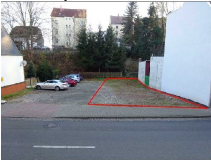
Ansicht von Ronneburger Straße

Fotos: Einlieferer Karten: Sachsen Viewer