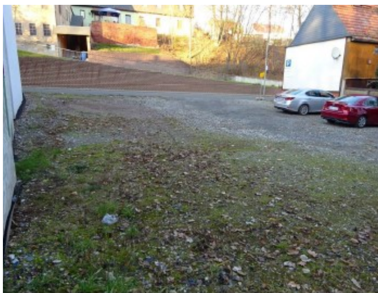
Ansicht zur Ronneburger Straße