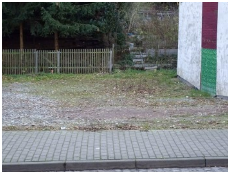
Ansicht von Ronneburger Straße