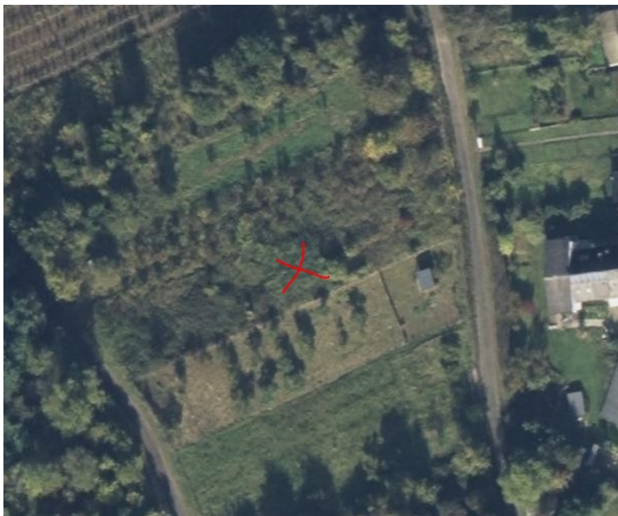
Ungefähre Lage des Verkaufsobjekts